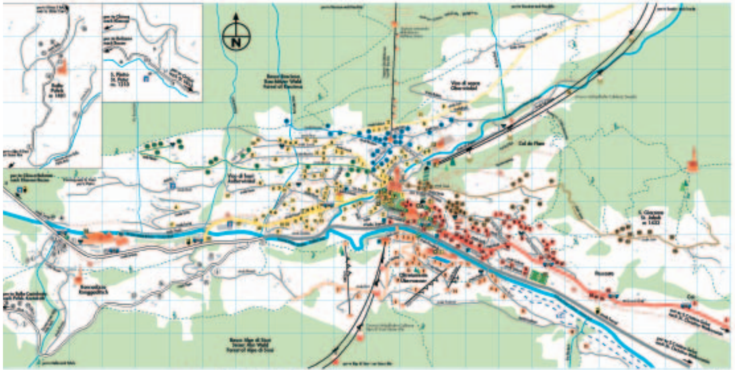
La cherta nueva de Urtijèi cun i 7 culèures.

la tofles. Per chësc proiet iel nce uni metù su na grupa de lèur che à laurà ora duc i particuleres y do truep lèur de proietazion y preparazion iela tan inant che n finerà chisc dis de mèter su duta la tofles nueves. Sciche dij I polizai de chemun Carl Runggaldier che ti ie stat do ai lèures, iel bèn da se aspitè n miuramènt dla viabilità per la sajón da d'inviern y per i ani che vèn. Ma I nvit ti vè a duta la populazion de se nuzé de chësc sistem nuef nce canche n muessa fé unì zachei n cèsa o che n aposta velch.