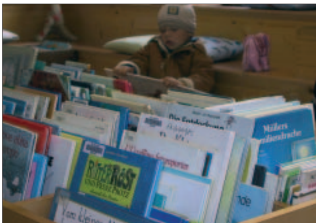
La Bibliotech pieta da 10 ani si servisc a gran y pitli.