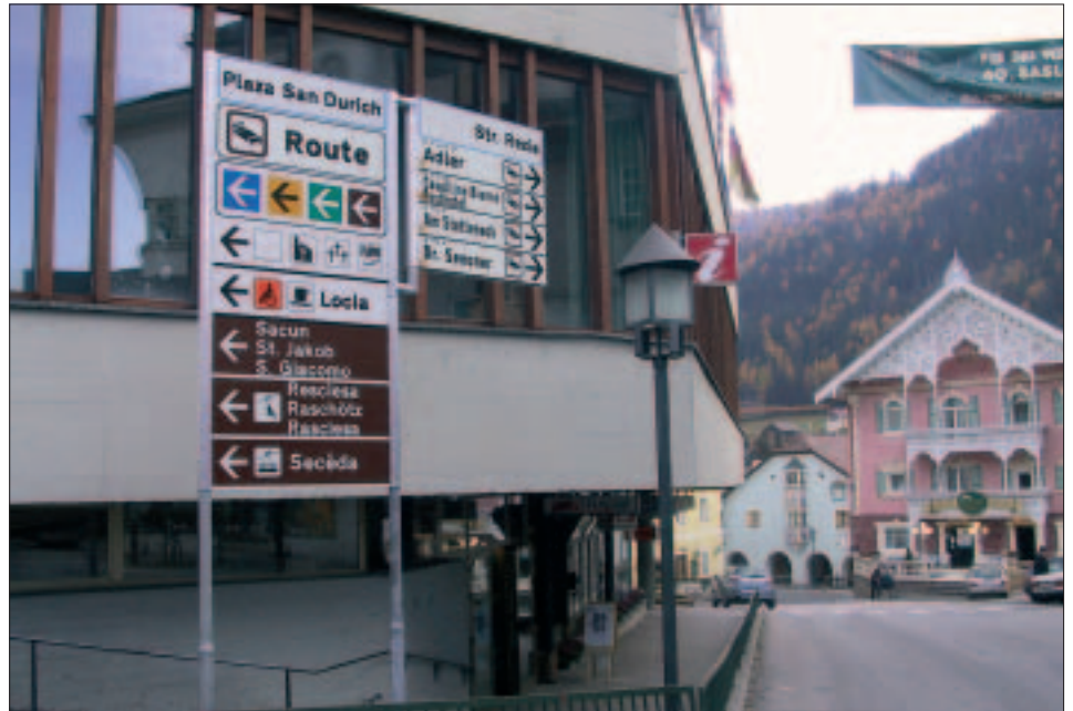
La tofles nueves fej na bela paruda per l luech.