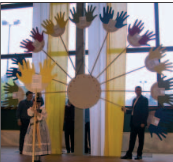
"Die Farben des Volontariats": Symbol für das Geben und Nehmen.

Als Rahmenveranstaltung gaben mehrere Vereine und Gruppen an Informationsständen Auskunft über ihren Wirkungsbereich. Diese Initiative wurde von der Bevölkerung mit großem Inter-