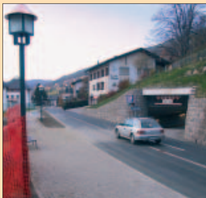
La nuova Streda Stazion.

Tenion perchël adum y lascons'ti nce ai andicaperi y a chèi che va a pé si lerch tl zënter.